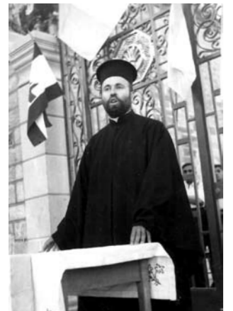
Le jeune missionnaire est rapidement devenu curé.