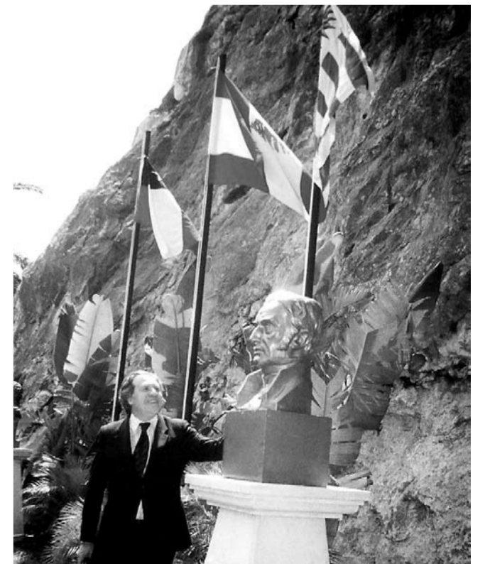
Le ministre uruguayen des Relations extérieures Luis Almagro au cours de la cérémonie à Jounieh.