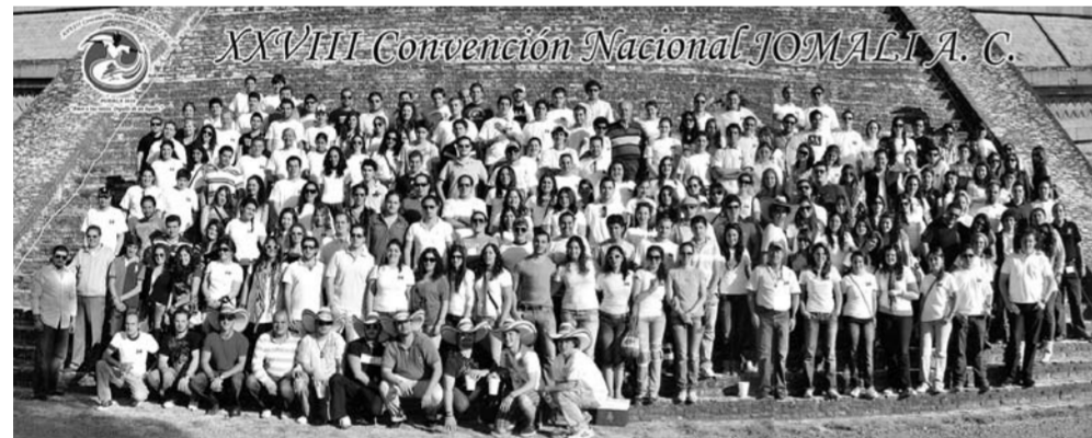
La photo annuelle de la convention libano-mexicaine de « Jomali » sur la pyramide de Cholula dans l'État de Puebla.