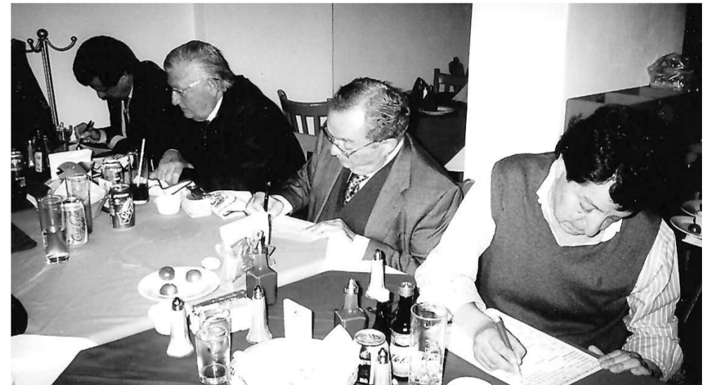
Inscription à l'annuaire RJLiban au restaurant Los Arcos à Mexico, en février dernier.

sur la vie de la communauté ainsi que des textes de référence historiques, publiés en espagnol et en arabe.