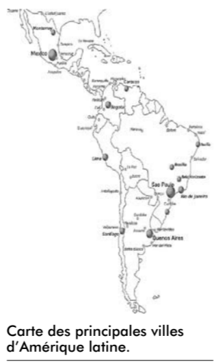
Carte des principales villes d'Amérique latine.

Parmi les projets du CECAL, qui est le premier centre du genre au Moyen-Orient, figurent le développement d'une bibliothèque latino-américaine ; l'enseignement des langues espagnole et portugaise et des littératures latino-américaines ; l'organisation de conférences et d'expositions. Plus d'informations sur le site : http://www.usek.edu.lb ou par e-mail : mailto:robertokhatlab@usek.edu.lb .