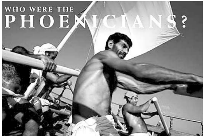
Les Phéniciens en couverture de la revue « National Geographic ».