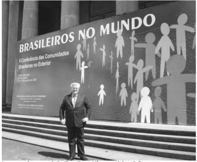
Le consul général du Brésil au Liban, Michael Geep.

Pour en savoir plus Brasilciros no Mundo - Ministère des Relations extérieures du Brésil