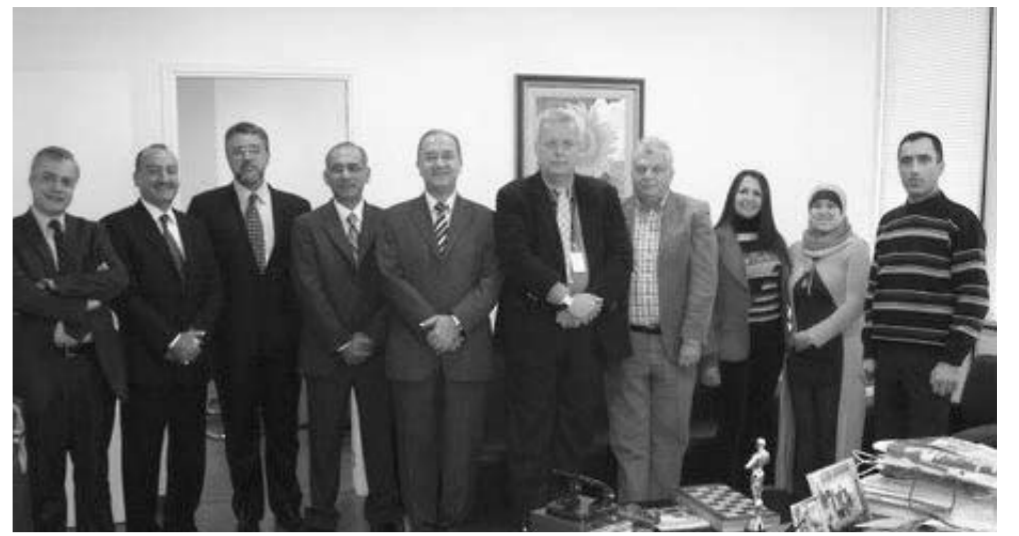
Le premier Conseil des citoyens brésiliens au Liban.

Les familles d'émigrés libanais ont commencé à retourner au Liban dans les années 1920, période correspondant à la fin de la domination ottomane et à l'instauration du mandat français. D'autres les ont suivis plus tard, certains « ré-émigrant » en Europe, en Afrique (Angola...), en Amérique et en Australie (où existe une forte communauté). Au