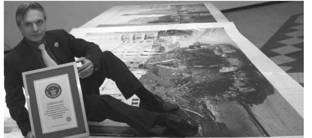
Le photographe Ayman Trawi, auteur de « La Mémoire de Beyrouth »

Après le succès de l'exposition des photographies d'Ayman Trawi, « La Mémoire de Beyrouth », tenue à Montevideo, de mars à mai derniers, décision a été prise d'organiser d'autres expositions dans différentes villes d'Uruguay. Sous les auspices de l'ambassade d'Uruguay au Liban,