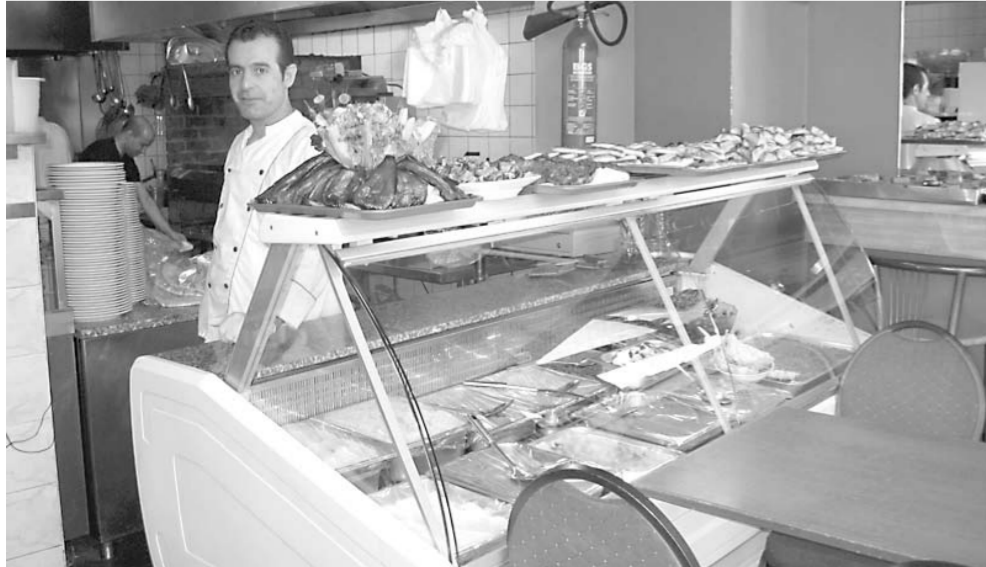
La cuisine où se déroulent les discussions enflammées...

Pour en savoir plus sur ce lieu hors du commun, les internautes peuvent se rendre sur le site Internet du Mont-Liban, www.montliban.be