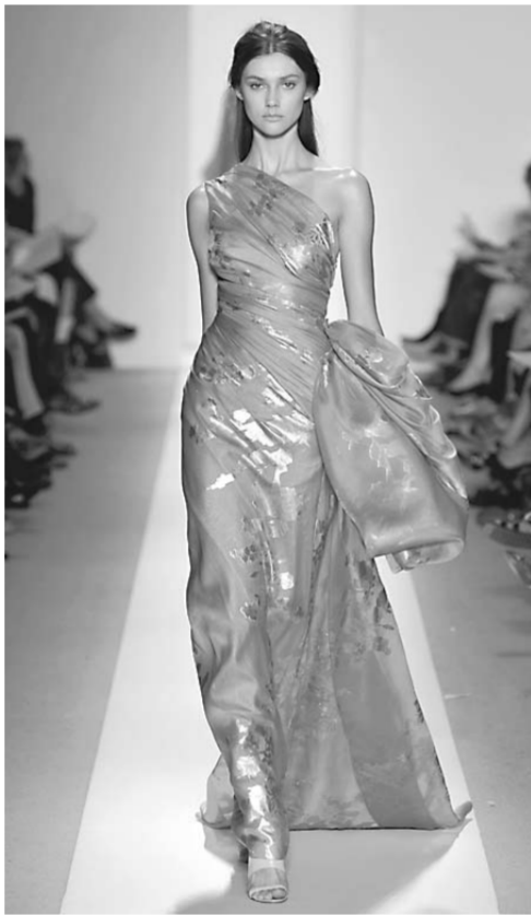
Deux des créations de la dernière collection de Reem Acra.