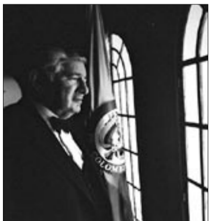
Julio Cesar Turbay : président de la République de Colombie de 1978-1982