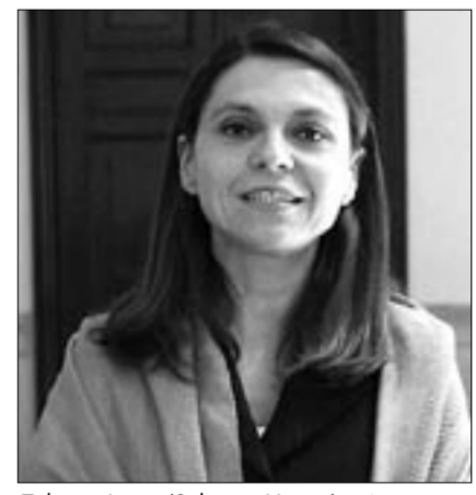
Zulema Jattin (Suleima Hatem) : sénatrice et présidente de la Chambre des députés en 2005.