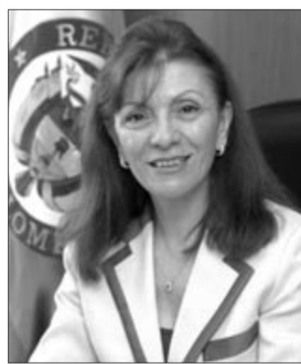
Georgine Mallat, ambassadrice de Colombie.

Parmi ces centaines de milliers de Colombiens d'origine libanaise, pourquoi si peu sont-ils intéressés à s'inscrire ou inscrire