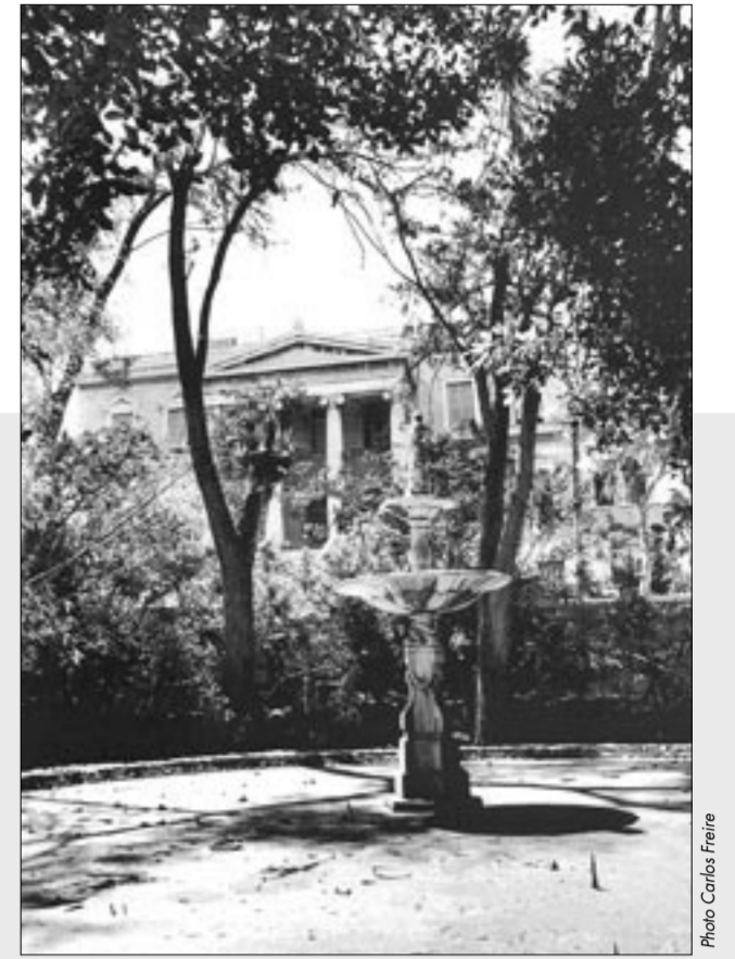
Maison de style grec appartenant à une famille d'origine libanaise, quartier de Rouchdy, Alexandrie

l'esprit de créativité qui anime les Libanais à travers le monde, se posant comme une plateforme pour tous les amis de ce pays qu'elle invite à demander leur carte des Amis du Liban via son site Internet. Et puis il n'y a pas que les gens qui émigrent, certains mesurent toujours leur chance d'être au Liban. Un Français vivant à Beyrouth raconte son histoire d'amour pour ce pays, les avantages professionnels et sociaux qu'il offre et le potentiel touristique qui, selon lui, devrait être exploité. Enfin, le point est fait sur la création de l'Association Alsace-Liban à Strasbourg, suite aux derniers feux de forêts dévastateurs dans la montagne libanaise.